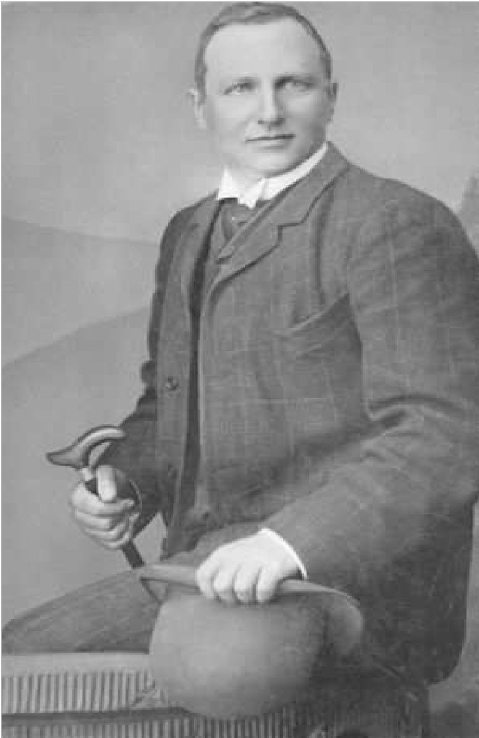
Oskar Panizza (1853-1921)