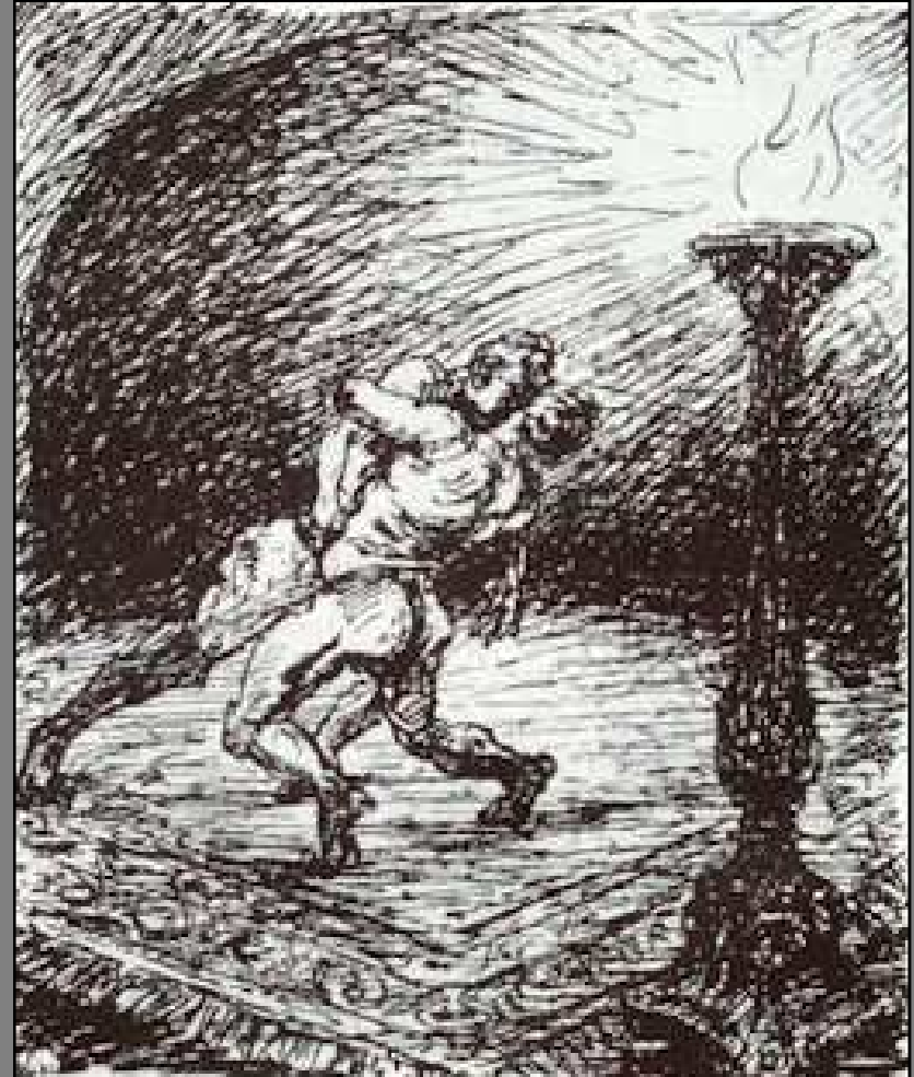
Alfred Kubin, Das Liebeskonzil , 1913