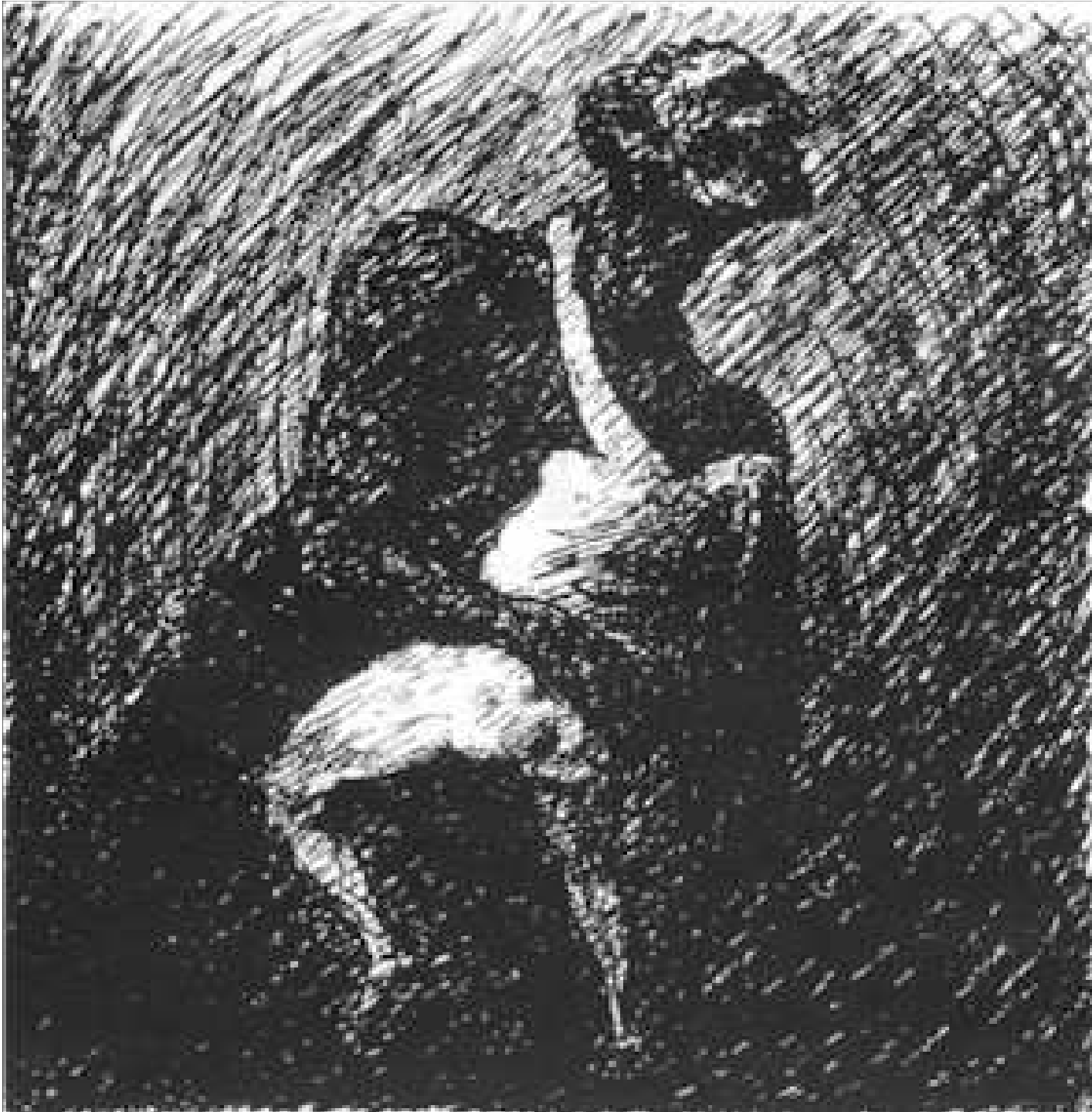
Alfred Kubin, Das Liebeskonzil, 1913