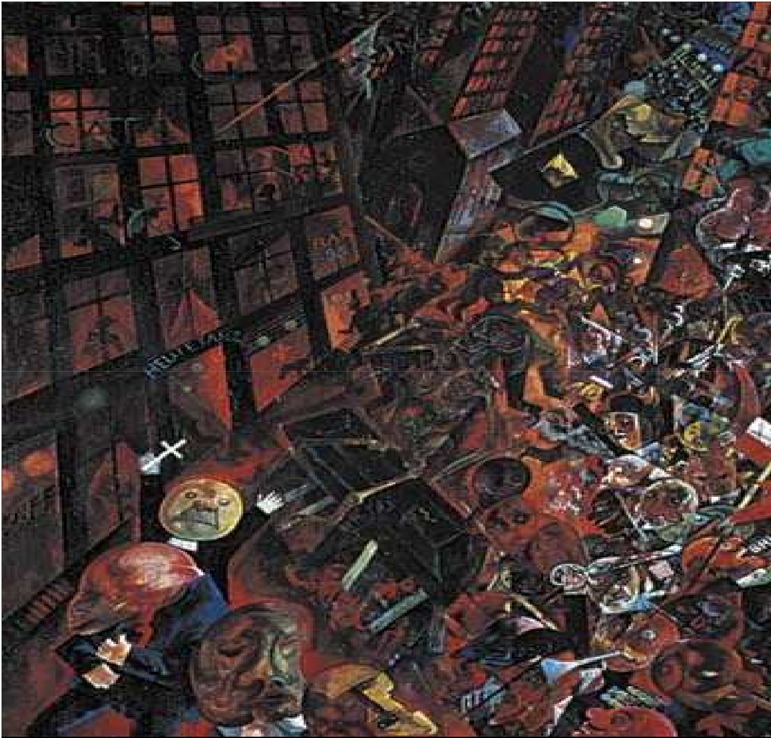
Georg Grosz, Widmung an Oskar Panizza